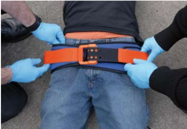
Figuur 4. Het aanbrengen van de SAM Sling gebeurt met twee hulpverleners. Beide trekken de band voorzichtig naar zich toe. Hierdoor komt de spanveer op de juiste spanning. Hierna worden beide uiteinden vastgeplakt met het klitteband.