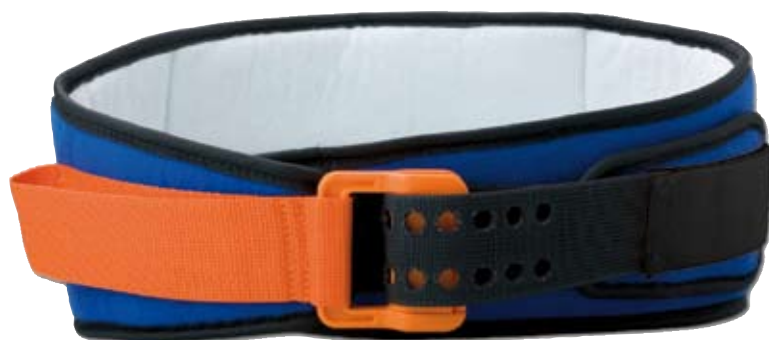
Figuur 3. De SAM Sling.

Figuur 2. De drie stappen in het prehospitala onderzoek. Levert de eerste stap (links) al een indicatie voor bekkenletsel op, dan zijn stap twee (midden) en drie (rechts) gecontraïndiceerd.